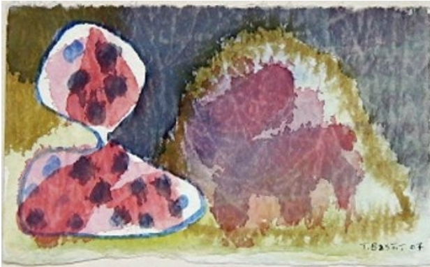
Bergère Aquarelle 2007 11 x 19 cm 140 €