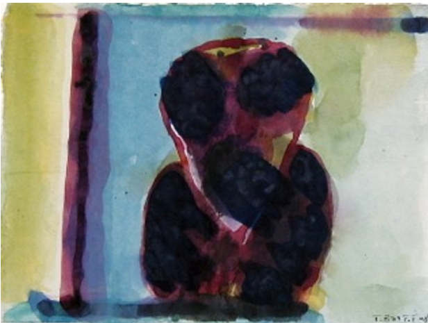
Rapace Aquarelle 2008 15 x 21 cm 260 €