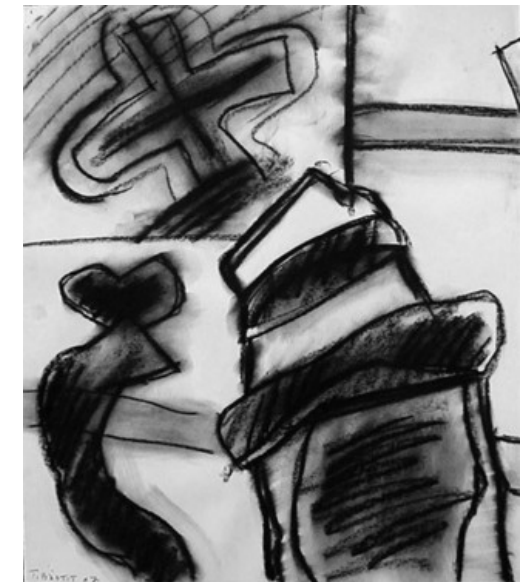
Raymond Fusain 2008 46 x 39 cm 550 €